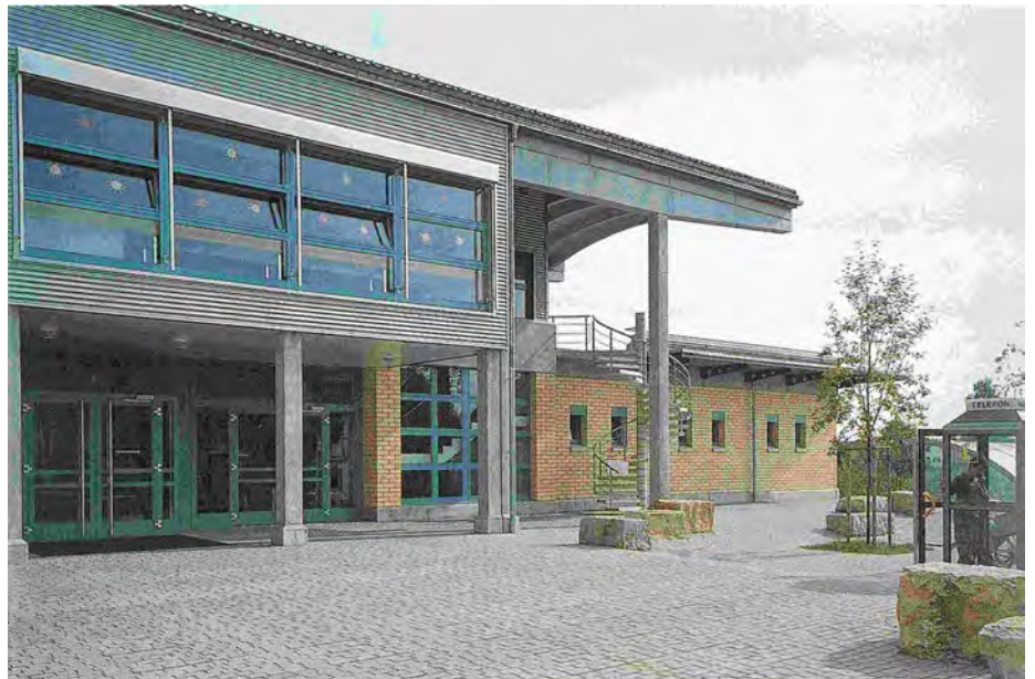
Eingangsbereich Mehrzweckgebäude Und Kirchgemeindehaus

Die Entwurfsidee basierte auf dem Spannungsfeld „Alt und Neu“. Das alte Schulhaus und der Neubau konkurrenzieren sich nicht, sondern sind heute städtebaulich, funktionale und formale Ergänzungen. (Eternit 1/95).