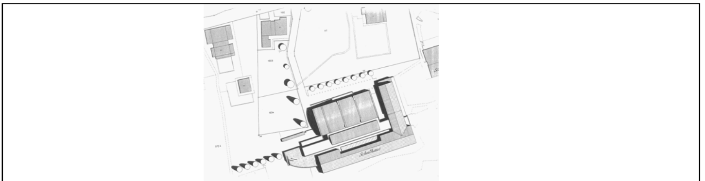
Situation / Dachaufsicht