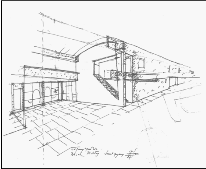
Skizze Eingangspartie Bereich Richtung Saalzugang