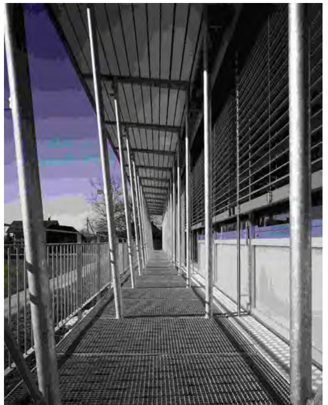
Beschattungsanlage / Putzbalkon / Fluchtweg